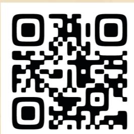
図書館ホームページ

自家用車での来場はご遠慮ください。タクシーでお越しになる場合は西門をご利用ください。キャンパス内は全面禁煙となっております。あらかじめご了承ください。